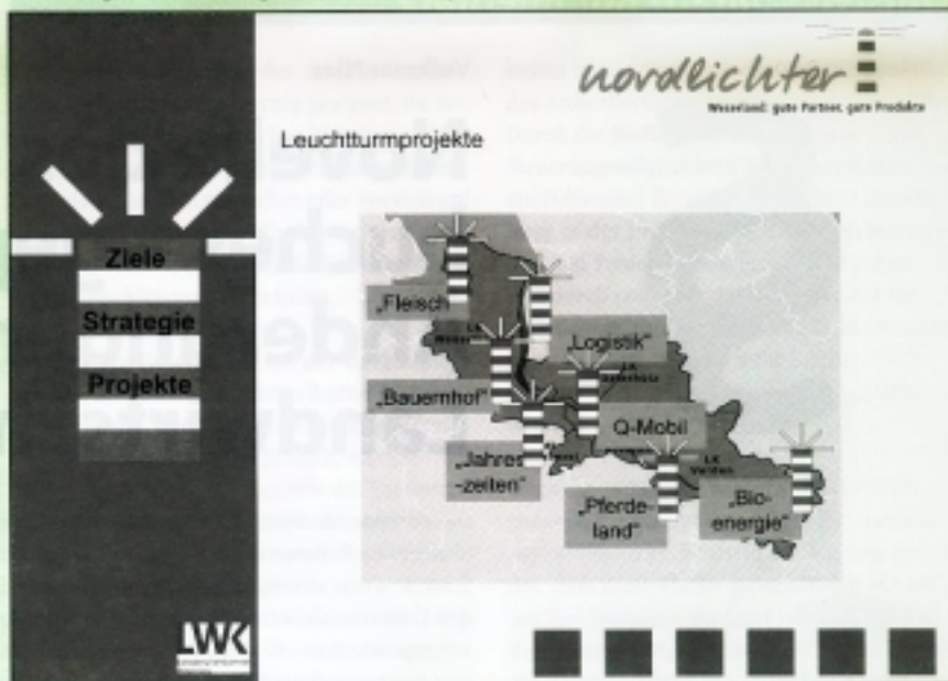
Abbildung 2: Leuchtturmprojekte in der Region Weserland

ausforderungen für die Beratung in Projekten der Regionalentwicklung auf folgende Aspekte: